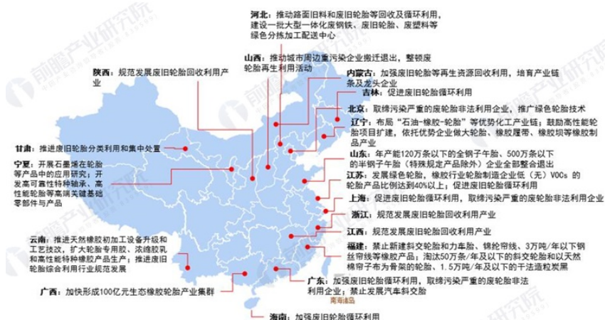
图表 18: 各省市层面轮胎行业发展目标解读